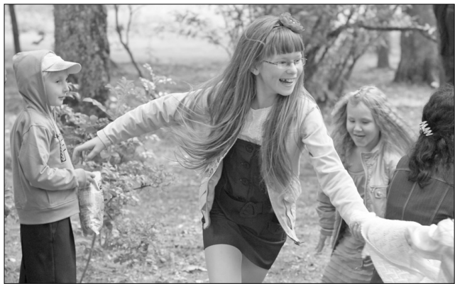
Zinību dienas koncerta emociju viņi.