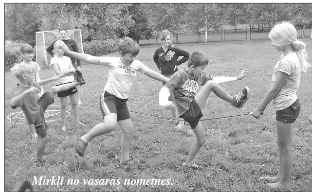
Mirkli no vasaras nometnes.

Katra diena Vārkavas pamatskola iesākas ar priecīgiem «labritiem». Apkārt ir draugi, draudzenes, skolas personāls un skolotāji, kas vasarā pacentušies sapost gan skolas iekšējās, gan apkārtni, gan pagatavot skolas kopsaldam garšīgus konservējumus, gan izdomāt dažādus pasākumus visa jaunā mācību