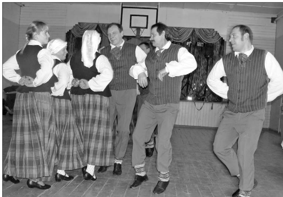
Uzstājas deju kopa «Vanagi».

● Rožkalnu pagasta pārvaldes un Rimicānu pirmsskolas izglītības iestādes telpas ir skārušas pārmaiņas. Šobrīd bijusi lasītava top par rotaļu istabu bērniem: tajā veikts pamatīgs remonts - mainīti logi un pakāpieni, grīdas segums; iekārti griesti, aplikti radiatoru sienas nokrāsotas spilgti dzeltenā krāsā, viena siena tiks apgleznota.