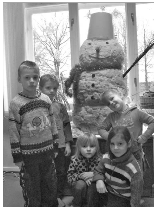
«Sprīdīša» audzēkņi pie pašdarinātā sniegavīra.

RPII grupiņas «Zīlūks» bērni, audzinātāja un auklītes.