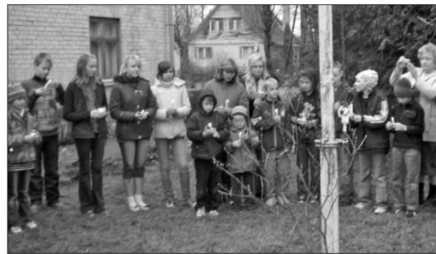
Vanagu pamatskolas skolēni un skolotāji 16. novembrī vienotās kopējā lūgšanā par nākotni.

22. decembrī plkst. 9.00 Ziemassvētku svētrītā un