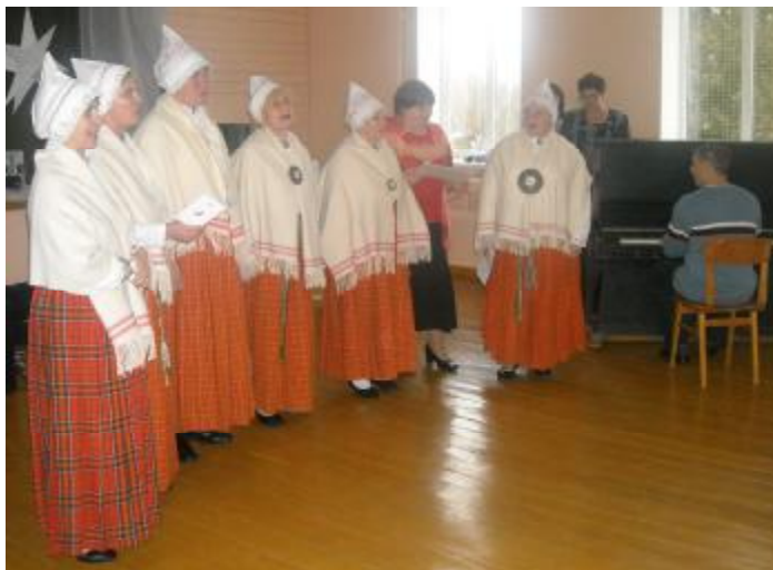
Folkloras kopa „Vecvārkava” pensionāru vakarā Vanagos.