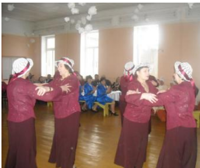
Savu dejotprasmī demonstrē Dāmu klubiņš. Par mūziku rūpējās R. Kairāns