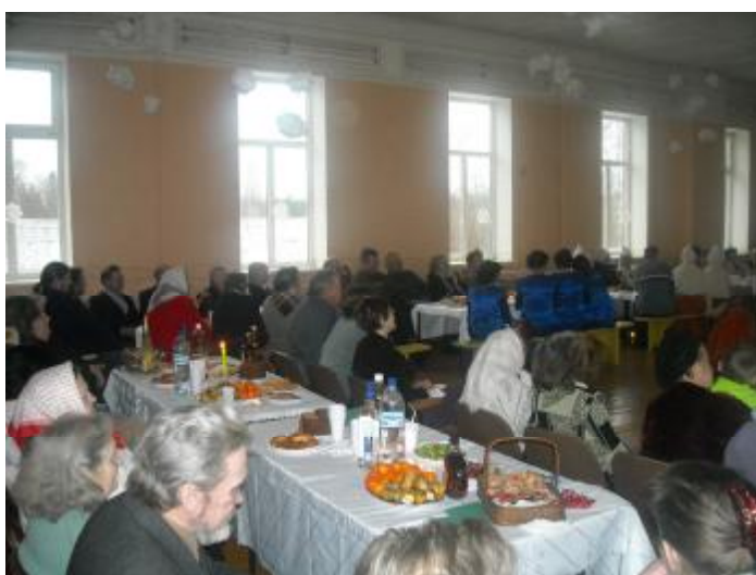
Zālē rosība notika gluži kā bišu stropā