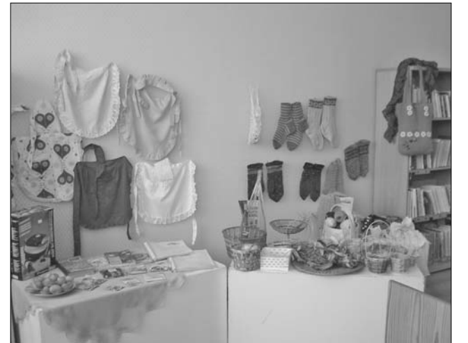
1.-5.klases projektu prezentācijas izstāde.

6.-7. klase projekta darba nosaukums bija «Psalmu dziedātāji Vārkavas novadā».