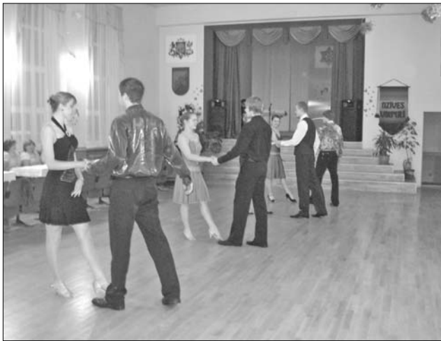
Vārkavas vidusskolas moderno un sporta deju grupas «Vita» jaunieši dejā aizrauj ar jaunības spēku un kustību skaistumu.

pas «Daina» dalībnieces un Vārkavas vidusskolas moderno un sporta deju grupas «Vita» jaunieši.