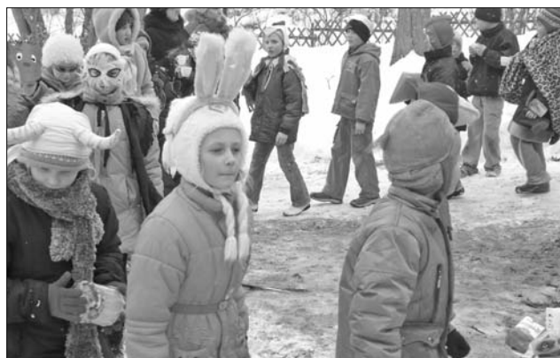
Masku gājiens pie Vārkavas pils.

Vārkavas vidusskolas sākumskolas un 5., 6., 7. klases skolēni prata gan tautasdziesmas par Metēņiem, gan minēja mīklas, gan bija pagatavojuši dažādus grabuļus ziemas aizbaidīšanai, bet čaklākie bija parūpējušies par maskām, jo Metēņos beidzās budžeta iešanas laiks. Jautrība turpinājās gan pie vidusskolas, gan pie Vārkavas pils, kur uzstājās folkloras kopa «Dzeipurs» un «Vecvārkava». Dziedot un dejojot, Metēni dzenot, auglība un labs ražas iznākums katrā sētā šogad būs nodrošināts. Teic, ka vārda «Metēnis» skaidrojums reizēm tiek saistīts ar vārdu «mest», attiecinot to uz laika metienu, bet atrodami arī sadzīviskāki skaidrojumi, kas norāda, ka Metēņu dienā bērņus metuši sniega kupenās. Vārkavas novadā Metēņdienā pie pils neviens kupenā iemests bērņis netika konstatēts, vien tādi, kas paši šļūca no kalna lejā Dubnas virzienā.