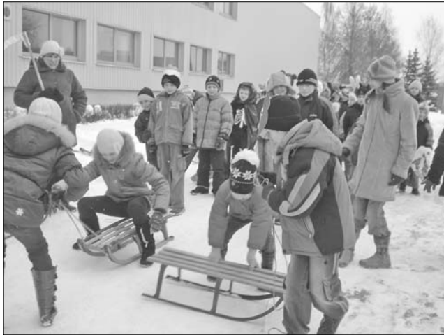
Meteņdienas tradīciju ievērošana pie Vārkavas vidusskolas.

Pavadot zimu, skolēni priecējās Meteņdienas pasākumos skolā un novadā.