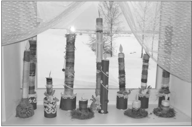
Rimicānu pirmsskolas izglītības iestādes audzēkņu veidoto sveču izstādē jaunajā rotaļu un atpūtas telpā.