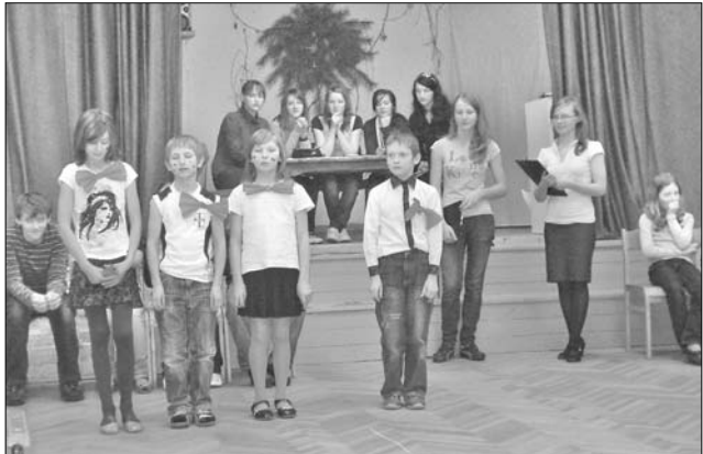
9.klases projekta «Sirsniņsvētki» prezentācija.

10. klases projektu nedēļas temats bija «Galdniecība un kokapstrāde». Skolēni veica aptauju par novadā zināmiem cilvēkiem, kuri apstrādā koku. Uz zinājām vairāk par šo nozari.