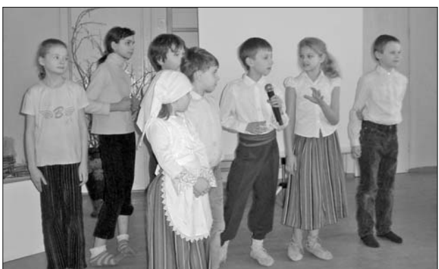
1., 4.klase prezentē projekta tēmu «Lauku sēta».

1., 4.klases projekta tēma bija «Lauku sēta». Nedēļas laikā tapa lielisks lauku sētas makets ar visām mājām un pat skolēnu paštaisītiem mājdzīvniekiem. Interesanta bija darba prezentācija, skolēni bija sameklējuši daudzus vecvārdus un vēlējās pārliecināties, vai arī mēs zinām to nozīmi.