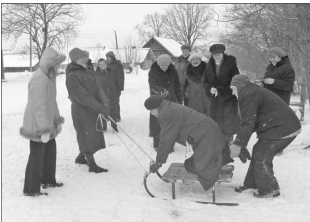
Pilišķu Metēņdienas izdarības – vizināšanās ragavās.