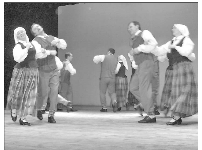
Bijušā Preiļu rajona novadu sadancī uzstājas vidējās paaudzes deju kopa «Vanagi».

Tautas deju kolektīvu novadu skates Latvijā norisināsies no 27. februāra līdz 16. maijam un to mērķis ir gatavoties Tautas deju ansambļu svētku lielkoncertam 22. maijā un VII vidējās paaudzes Deju svētkiem 5. jūnijā. Šie Deju svētki notiks Valmierā.