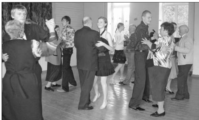
Vārkavas vidusskolas deju kopas «Vita» dalībnieki izdancia pensionārus.

Pēc jaukā vakara pensionāri solījās arī nākamreiz apmeklēt šādus pasākumus. Tā ir lieliska iespēja izrauties no pelēcīgās ikdienas, tikties ar seniem draugiem,