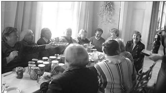
Pasākuma «Rudens veltes» apmeklētāji Vārkavas pagasta Tautas namā.

15. oktobrī Vārkavas Tautas nama telpās bija skatāma un baudāma izstāde - degustācija «Rudens veltes». Var tikai pabrīnīties par plašo rudens velšu sortimentu, ko bija sagādājušas Vārkavas pagasta saimnieces!