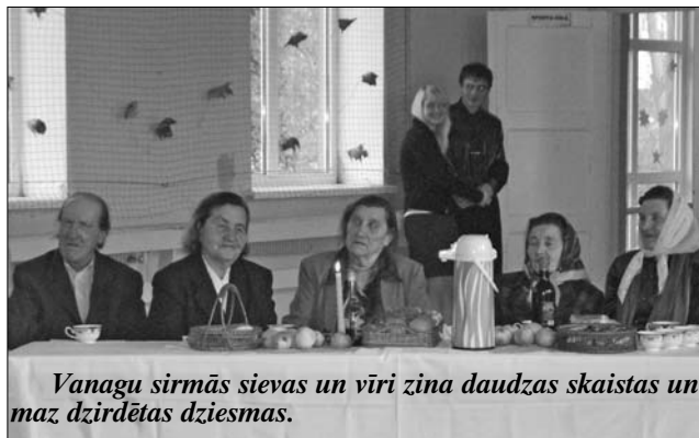
Vanagu sirmās sievas un vīri zina daudzas skaistas un maz dzirdētas dziesmas.