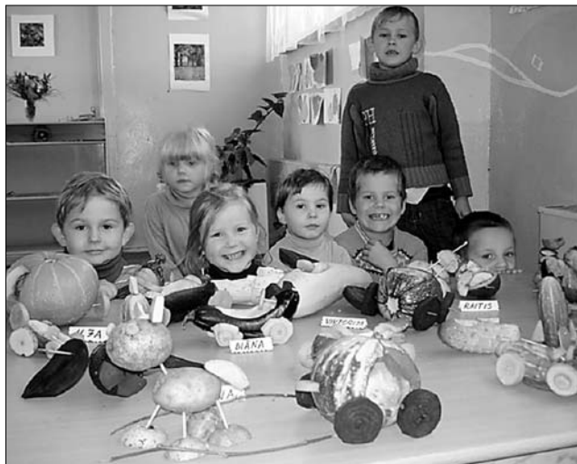
Arī paši mazākie Vārkavas pamatskolas skolēni varēs izmantot projekta «Skola lielam un mazam» piedāvātās iespējas.

Vēl tiks iekārtota tautas mūzikas instrumentu apmācības darbnīca, kurā varēs apgūt sitamo, pūšamo un stīgu instrumentu pielietošanas prasmes. Mērķis ir attīstīt prasmi darboties ar mūzikas instrumentiem un skaņu rīkiem tradicionālajā latviešu folklorā, kā arī pilnveidot skolēnu un pagasta jauniešu muzikālās dotības un ritma izjūti. Paredzamās aktivitātes – ierīkot skolā folkloras instrumentu apguves kabinetu, apgūt sitamo, pūšamo un stīgu instrumentu pielietošanas prasmes folkloras kopas kopskaņējuma veidošanā, apgūt pavadījumu folkloras kopai «Zubītes», sniegt koncertus vietējos un